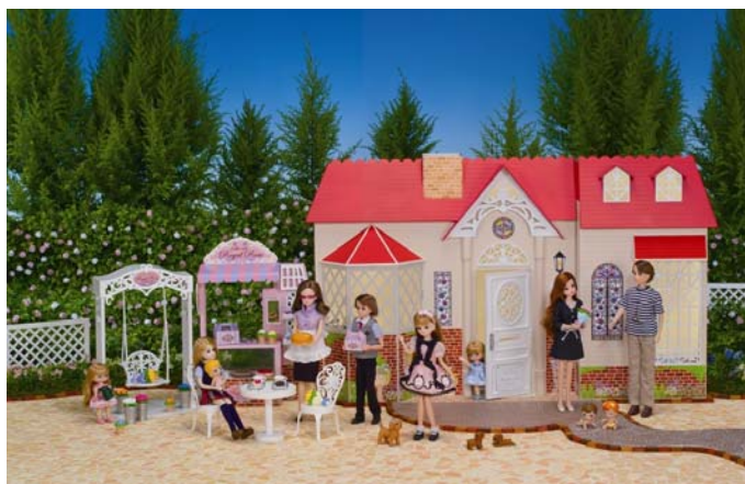
（右）「リカちゃんハウス グランドドリーム」 （左）「お花がいっぱいケーキ屋さん」*人形は別売り

1967年（昭和42年）の誕生から今年で45年、「リカちゃん」は常に時代や流行を反映しながら、少女たちの憧れや夢の暮らしを形にした商品を発売してまいりました。ファッションや職業のほか、家族もその時代を表現しています。1969年（昭和44年）に登場したママ（織江）はファッションデザイナーという時代の先端を行くビジネスウーマンでした。一方パパ（ピエール/フランス人）は、しばらく不在でしたが、20年後の1989年（平成元年）に発売となりました。これは、高度成長期、モーレツに働く日本の父親像から、週休二日制の導入なども相まって「マイホームパパ」が登場したことが背景にありました。