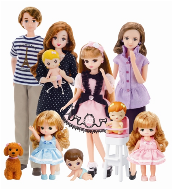
リカちゃんファミリー

名前 : 香山洋子(かやま ようこ) 誕生日 : 10月10日 星座 : てんびん座 年齢 : 56歳 趣味 : 料理・お菓子作り 好きな花 : バラ 職業 : 「ロイヤルローズ」という名のお花屋さん&カフェのオーナー